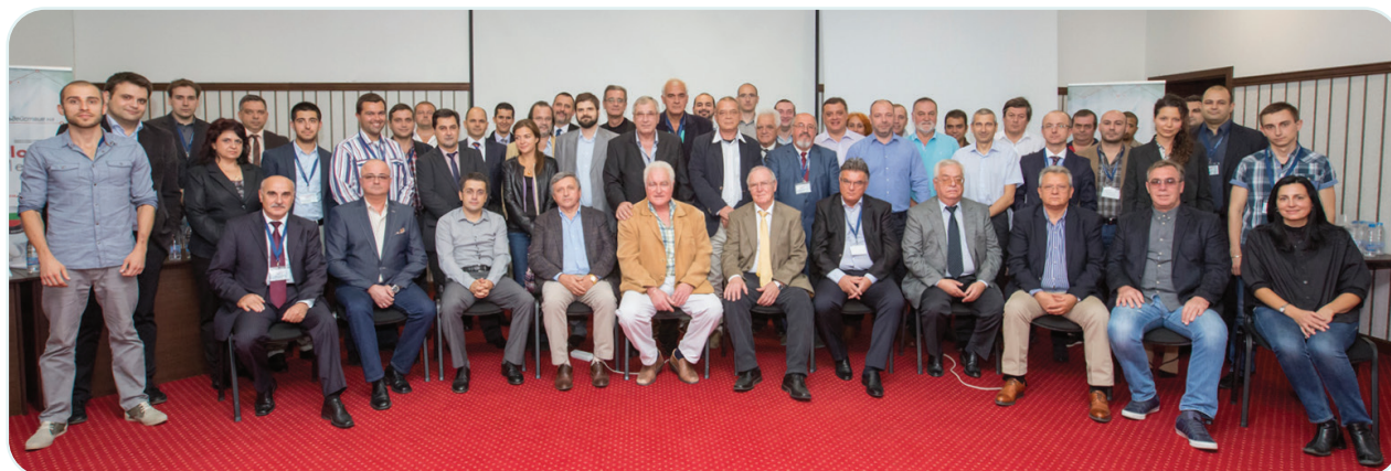
• Фиг. 2. Групова снимка по време на националната неврохирургична конференция, която се провежда в гр. Трявна през 2015 г., домакин е клиниката по неврохирургия на УМБАЛ „Д-р Георги Странски“, Плевен.

Една от основните функции на БДНХ са международната дейност, комуникацията и обмен. Политическата