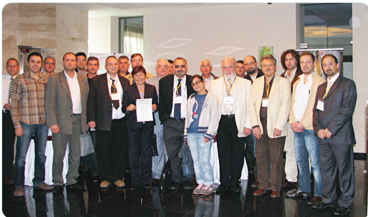
Фиг. 5. Преподаватели и участници в първия курс на AOSpine, проведен в България през 2008 г.

Югоизточноевропейското неврохирургично дружество (SeENS) е професионална организация с основна цел да подобрява качеството на неврохирургичната помощ, обучението и научните изследвания в Юго-